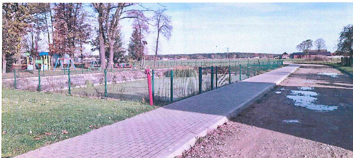
Zdjęcie 6. Staw w miejscowości Czastary przy ul. Wolności

Staw strażacki w miejscowości Czastary usytuowany przy parku ul. Wolności. Zbiornik położony na działce gminnej nr 1568/1 obręb Czastary. Obok znajduje się plac zabaw oraz ośrodek sportowo-rekreacyjny – boisko. Przeznaczony dla strażaków nabierających wodę do beczkowsów, zabezpieczony siatką. Zbiornik nie pełni funkcji rekreacyjno - wypoczynkowych.