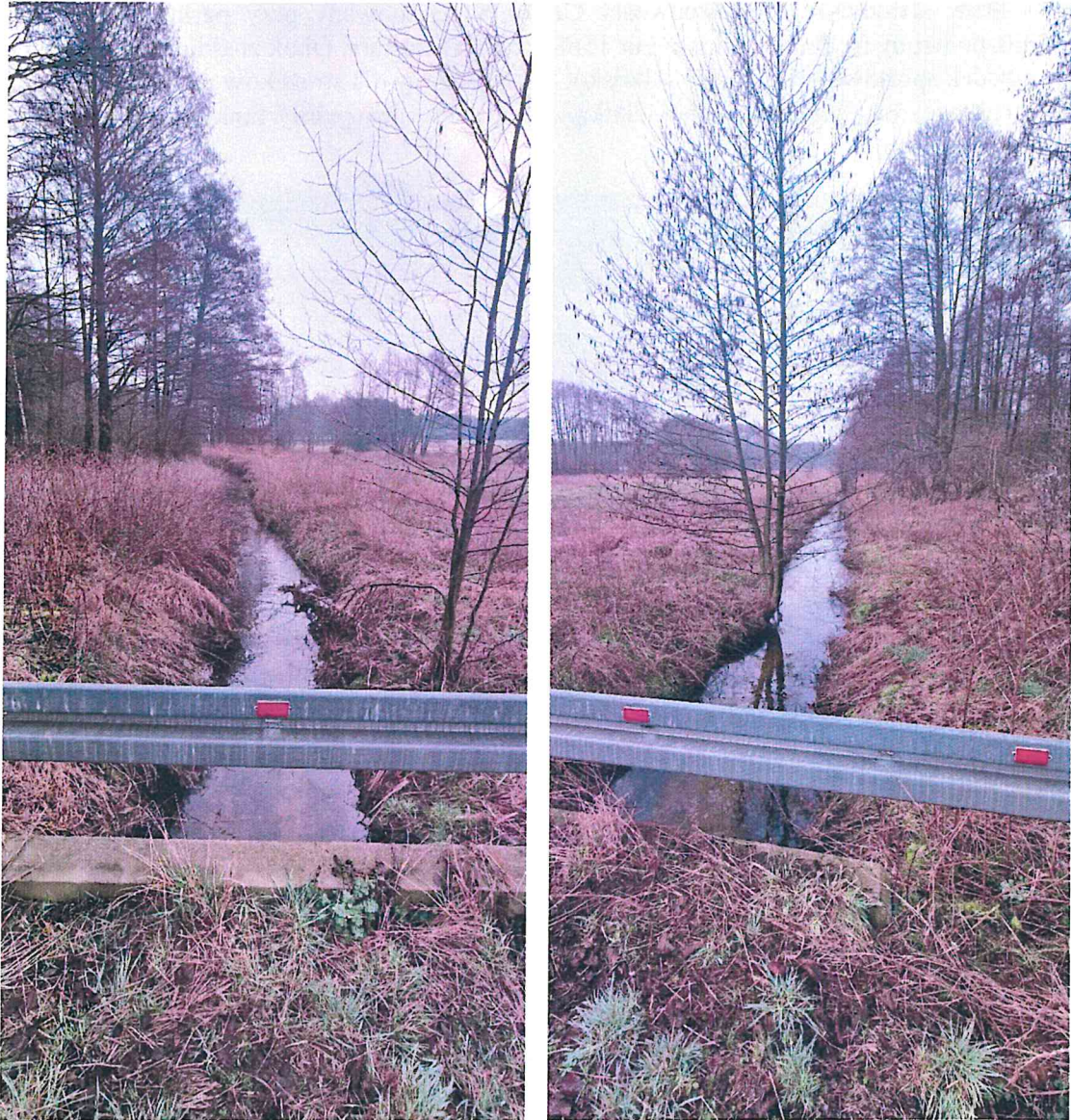
Zdjęcie 4 i 5. Ciek wodny „dopływ spod Brzezin”.

Cieki płynące na terenie Gminy Czastary nie nadają się do kąpieli. Miejsca nie wymagają szczególnego nadzorowania i oznakowania.