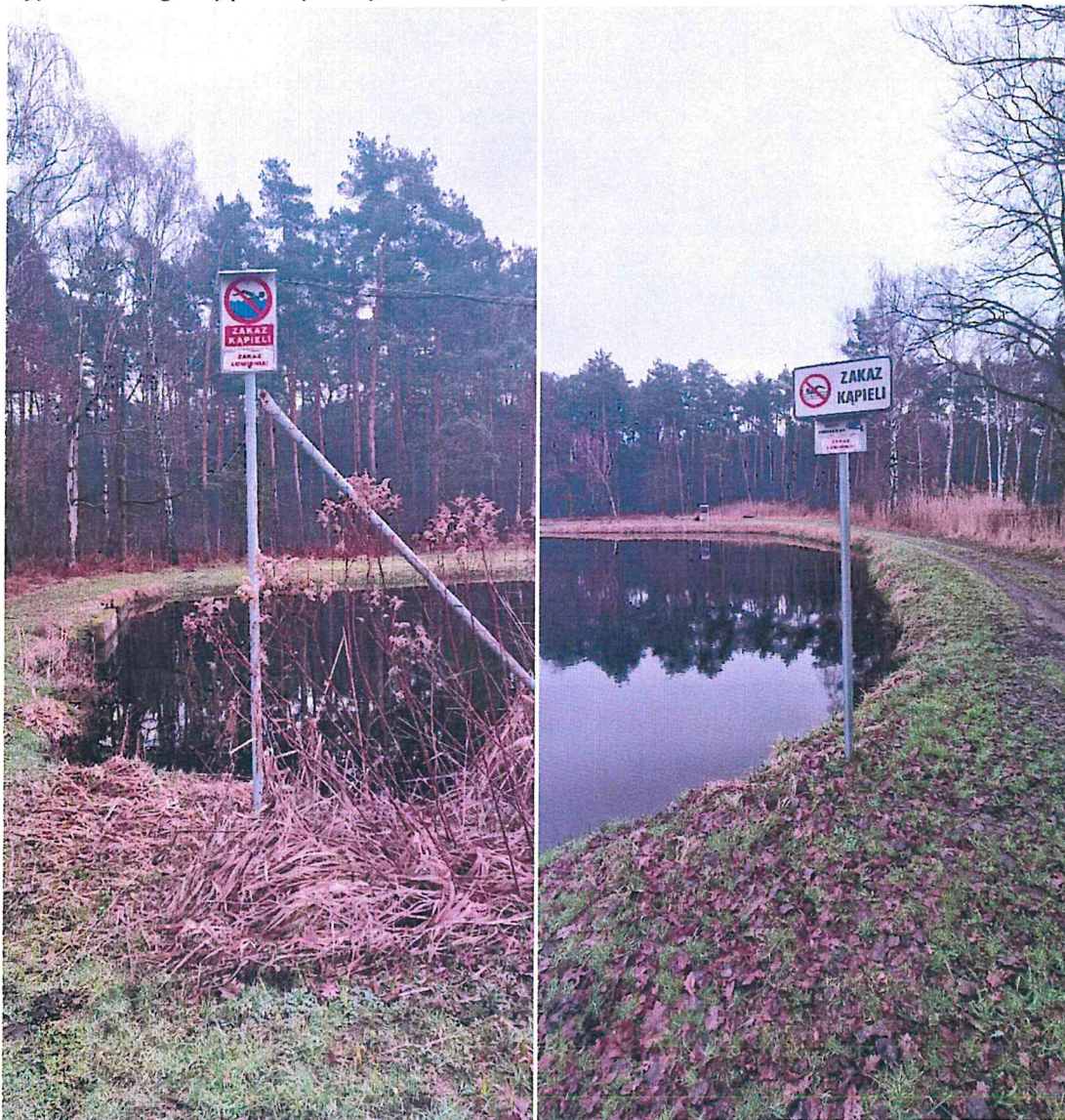
Zdjęcie 14 i 15. Staw gminny położony w miejscowości Józefów