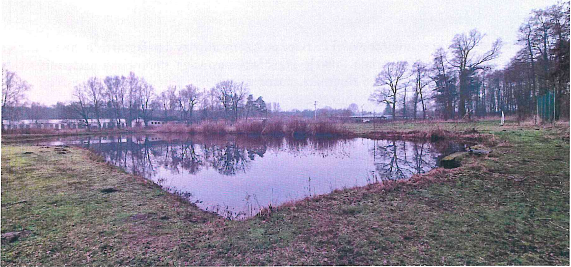
Zdjęcie 13. Staw gminny położony w miejscowości Józefów