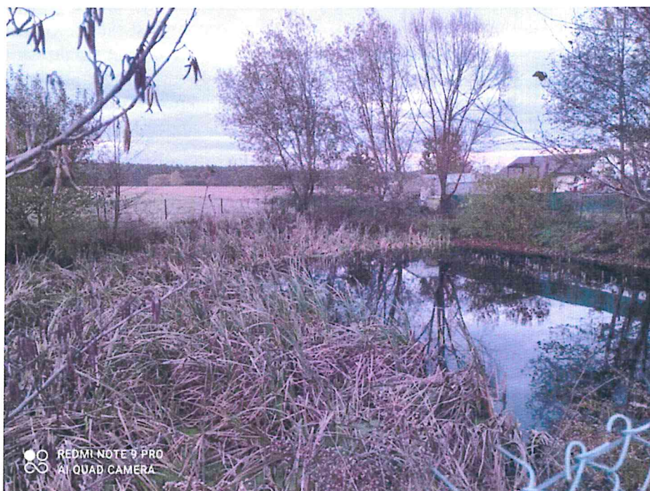
Zdjęcie 8. Staw w miejscowości Kniatowy