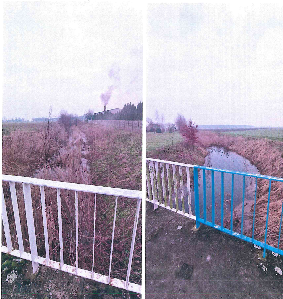
Zdjęcie 1 i 2. Pomianka – rzeka - dopływ Prosny w miejscowości na Krzyż

Dopływ w miejscowości Krzyż. Miejsce zabezpieczone barierkami. Akwen nieoznakowany i niestrzeżony.