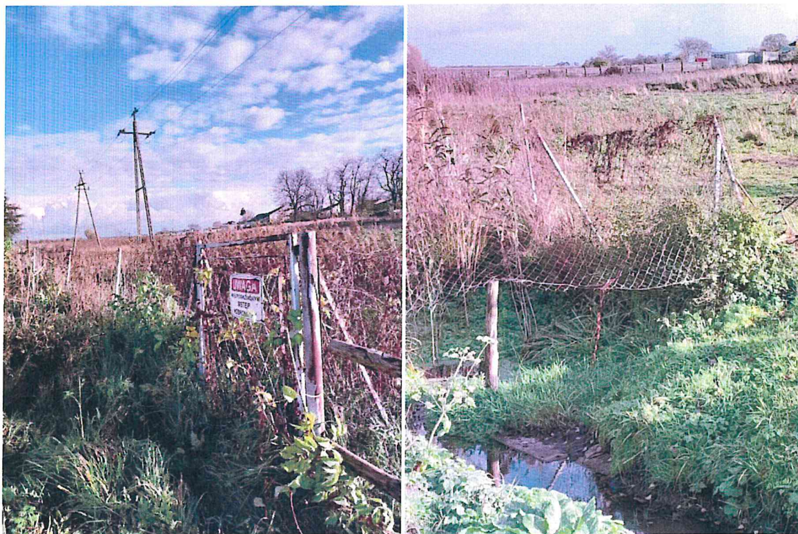
Zdjęcie 10 i 11. Zbiornik w miejscowości Kąty Walichnowskie.

Staw strażacki w miejscowości Kąty Walichnowskie usytuowany jest przy ul. Spacerowej na działce gminnej nr 160 oraz 161/1 i zabezpieczony jest siatką. Zbiorniki pełnią funkcję przeciwpożarowego stanowiska czerpania wody i się nie nadaje się do kąpieli. Obok znajduje się plac/boisko wykorzystywane do organizacji zwozów sportowo-pożarniczych oraz wydarzeń rekreacyjnych dla mieszkańców sołectwa Kąty Walichnowskie. Wejście do zbiornika znajduje się od strony placu/boiska. Dno zbiornika mocno zamulone i porośnięte roślinnością.