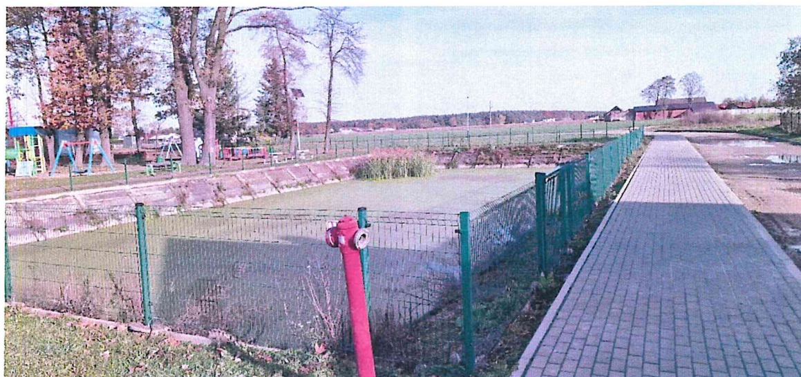
Zdjęcie 7. Staw w miejscowości Czastary przy ul. Wolności

Staw strażacki w miejscowości Kniatowy położony na działce gminnej nr 112 oraz 113 obręb Czastary. Zbiornik zabezpieczony siatką a jego dojście znajduje się od głównej drogi gminnej. Dno zbiornika mocno zamulone i porośnięte roślinnością. Zbiornik nie nadaje się do kąpieli.