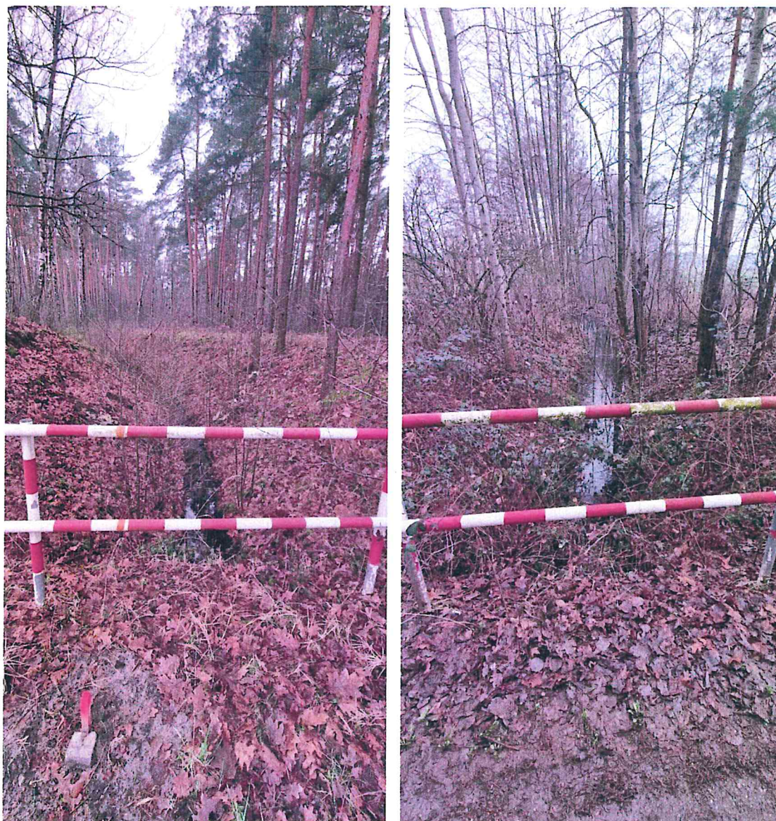
Zdjęcie 2 i 3. Ciek wodny „dopływ spod Czastar”.

Wschodnia część gminy odwadniana jest przez rzekę Pyszną i jej dopływy odprowadzające wody do Warty. Część zachodnią i północno-wschodnią gminy odwadniają cieki będące prawobrzeżnymi odpływami Prozny (Struga Węglewska, Brzeźnica, Nalepa) w tym ciek wodny „dopływ spod Czastar” oraz „dopływ spod Brzezin”. Cieki te nie sprzyjają kąpielom, gdyż są to rzeki meandrujące z licznymi starorzeczami. Ich brzegi porośnięte są gęstą roślinnością szuwarową i nie posiadają łagodnego spadku, dna są zatorfione i muliste, głębokość w dorzeczach zazwyczaj nie przekracza metra. Doliny rzek to w większości mniej lub bardziej intensywnie użytkowane łąki, ponadto występują zadrzewienia nadwodne – siedliska łąkowe wzdłuż cieków płynących i ziołorośli. Miejsce zabezpieczone barierkami. Akweny nieoznakowane i niestrzeżone.