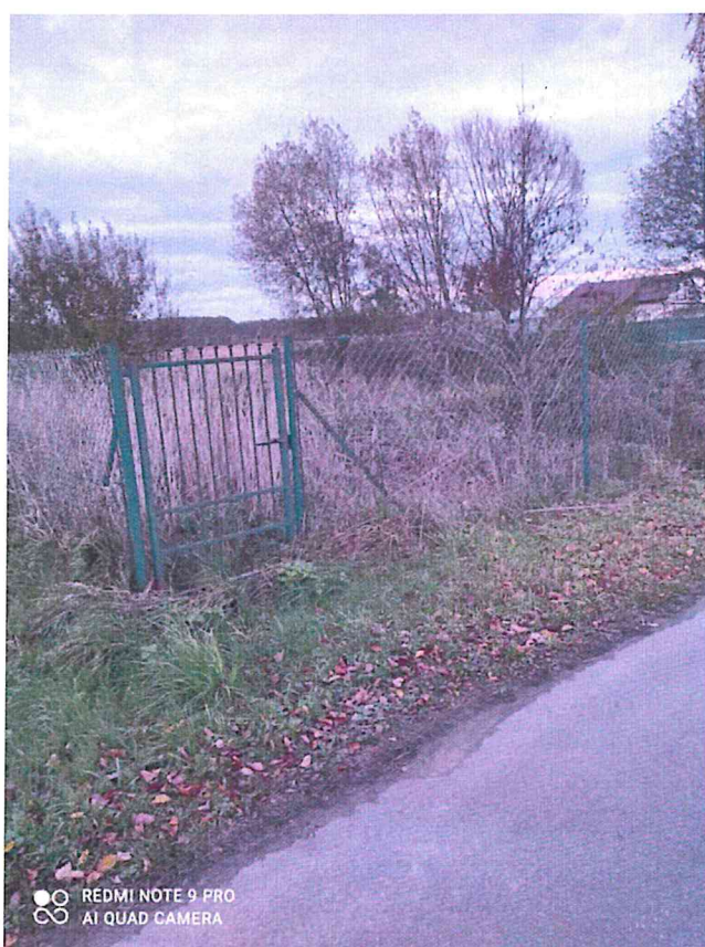
Zdjęcie 9. Staw w miejscowości Kniatowy